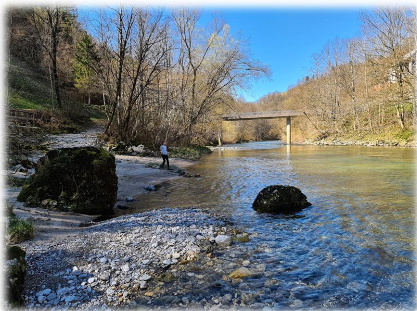
avtor fotografij: Dado Andder, marec 2020